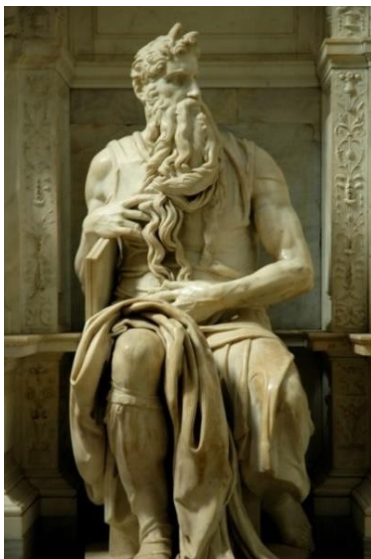
de Mozes van Michelangelo

Vandaag starten we onze wandeling bij San Clemente. Deze oude kerk is gebouwd op een oud Mitrasheilgdom. We bekijken (onder voorbehoud) de drie archeologische lagen van deze bijzondere kerk. Daarna lopen we naar de San Pietro in Vincoli waar het beroemde Mozesbeeld van Michelangelo te zien is. Vervolgens lopen we naar de vroegchristelijke Santa Prassede. Hier bekijken we zeer vroege mozaïeken en de schitterende ZENO kapel. Na de San Prassede wandelen we naar de Basilica Major Santa Maria Maggiore. We eindigen de morgen bij de thermen van Diocletianus.