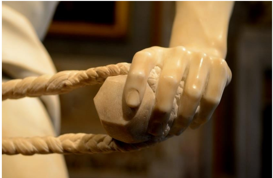
de David van Bernini in de Galleria Borghese

Na het bezoek aan de Galleria is er een transfer naar het centrum en lopen we in de richting van het centrum.