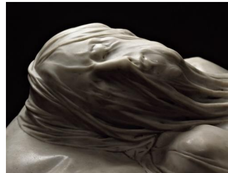
de Gesluierde Christus van Sammartino in de San Severokapel

Na de ochtend waarbij u de San Severeokapel kunt bezoeken en verder ook nog op eigen gelegenheid de stad kunt verkennen vliegen we in de middag terug naar Nederland (Amsterdam). Van daaruit is er een transfer naar Maastricht geregeld.