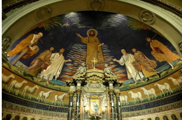
apsismozaïek in de Santi Cosma e Damiano

Na de lunch verplaatsen we ons naar het hooggelegen plein Campidoglio voor een bezoek aan de Capitolijnse Musea (met o.a. beroemde klassieke beeldhouwwerken als het ruitersstandbeeld van Marcus Aurelius, de stervende Galliër en de kolos van Constantijn, maar ook werken van Bernini en Caravaggio) en de vlakbij gelegen kerk Santa Maria in Aracoeli.