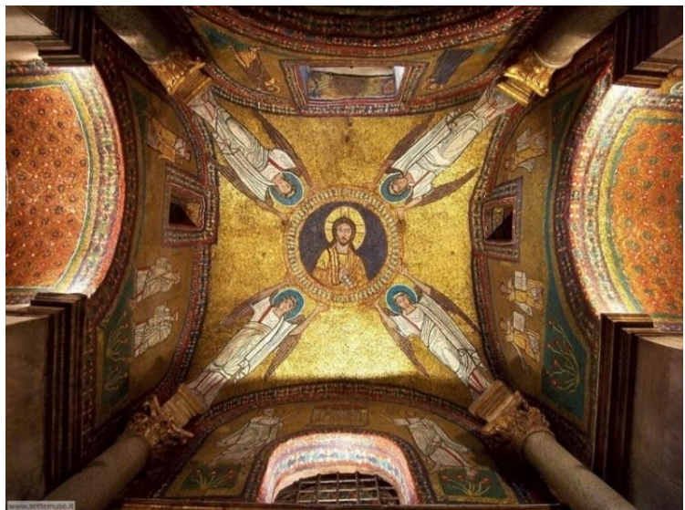
de Zenokapel in de SanPrassede

De Thermen van Diocletianus en de in het thermencomplex opgenomen kerk Santa Maria Degli Angeli e dei Martiri (van de Engelen en de Martelaren) gaan we bezoeken. Het betreft hier het grootste en indrukwekkendste thermencomplex uit de oudheid. Binnen krijgt u een indruk van de enorme ruimtes en maakt u kennis met de spectaculaire bouwconstructieprincipes van de Romeinen. (kruisgewelven en tongewelven)