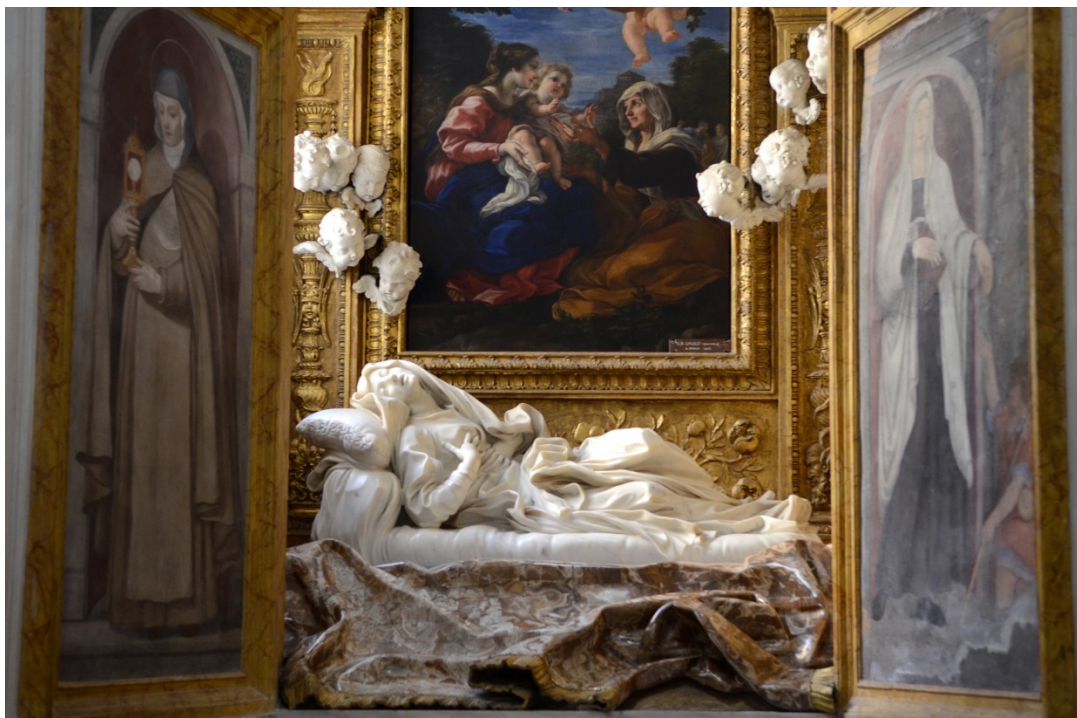
Bernini ludovica albertoni