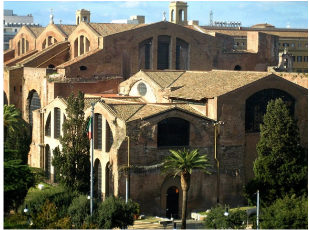
Thermen van Diocletianus

Na de lunch verplaatsen we ons in de richting van het circus Maximus. Van daaruit lopen we naar het oude Forum Boarium het plein van de Santa Maria in Cosmedin met de Bocca della Verita. We bekijken de tempel van Hercules Invictus en de goed bewaarde oude tempel van Portinus. We steken de Tiber over en bekijken de Fontana di Tartarughe. Via het Theater van Marcellus lopen we naar de Joodse wijk.