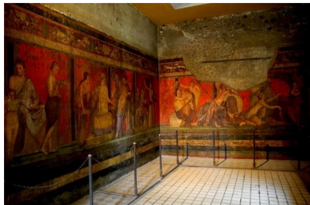
de Villa van de Mysteriën in Pompeï