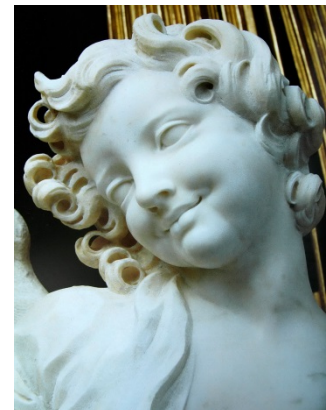
De extase van Teresa van Bernini