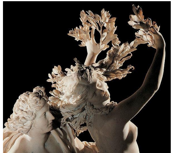
Apollo en Daphne van Bernini in de Galleria Borghese

We beginnen de dag op het Piazza del Popolo. Hier bekijken we de werken van Caravaggio en Bernini in de Santa Maria del Popolo. Vervolgens is er een flinke wandeling door het groen naar Galleria Borghese. Dit museum is gelegen in een prachtig park. In dit museum zijn de belangrijkste beelden van Bernini te zien. Ook zijn hier beroemde werken van Caravaggio te bewonderen.