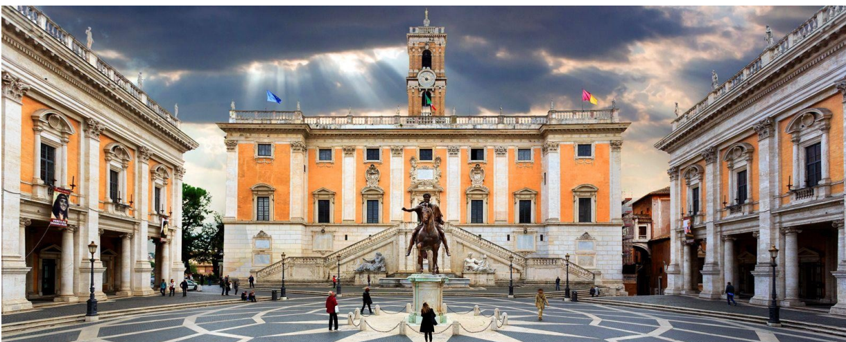
Campidoglio met het ruitersstandbeeld van Marcus Aurelius

Indien mogelijk bekijken we ook nog de Il Gesu kerk. De eerste kerk van de Jezuïeten en de architectonische aanzet van de barok. De ernaast gelegen kamers van Ignatius zijn ook zeer de moeite waard. Deze kamers zijn maar beperkt open maar het loont de moeite om de bijzondere perspectiefschilderingen van Pozzo te bekijken die speciaal voor een gang in het complex zijn gemaakt.