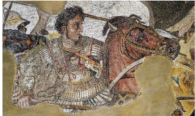
het uit Pompeï afkomstige Alexandermozaïek in het Archeologisch Museum (detail)

In de morgen bezoeken we het Nationaal Archeologisch museum van Napels met zijn hoogstaande collectie klassieke kunst. Vervolgens wandelen we naar het centrum en bezoeken, als de tijd het toelaat, de Santa Chiara en de San Giovanni a Carbonara.