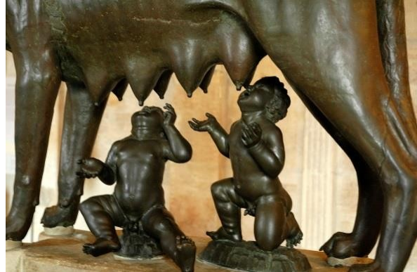
Boven: het Campidoglio met (een kopie van) het Romeinse ruitersstandbeeld van Marcus Aurelius; onder het symbool van Rome: de wolvin met Romulus en Remus in de Capitolijnse musea