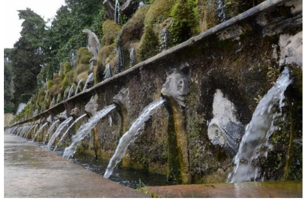
de Viale delle Cento Fontane in de tuinen in de Villa d'Este

Het gecombineerde bezoek aan het mausoleum van Santa Costanza (vroegge centraalbouw-kerk) en de Sant'Agnese fuori le mura is het laatste programmaonderdeel in de eeuwige stad. Daarna vertrekken we per bus naar de stad Tivoli voor de Villa van Hadrianus. Na een bezoek aan dit complex is er lunch op eigen gelegenheid in het stadje. In de middag bezoeken we de Villa d'Este. Deze villa is, na het drukke Rome, een ware oase van rust. Er is ruimschoots de gelegenheid om de vele waterpartijen te ontdekken in de manieristische tuinen.