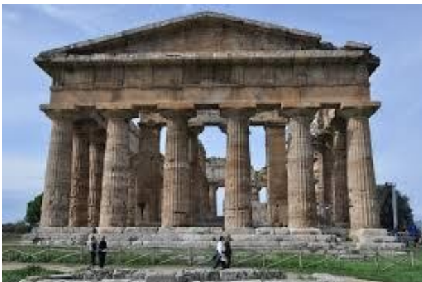
de tempel van Poseidon in Paestum